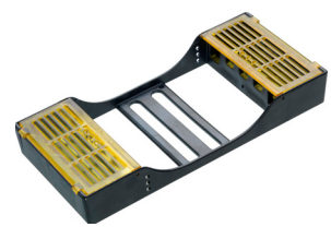
LM 6551 grau LM 6551T grau DTS