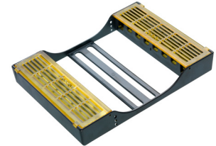
LM 6581 grau LM 6581T grau DTS